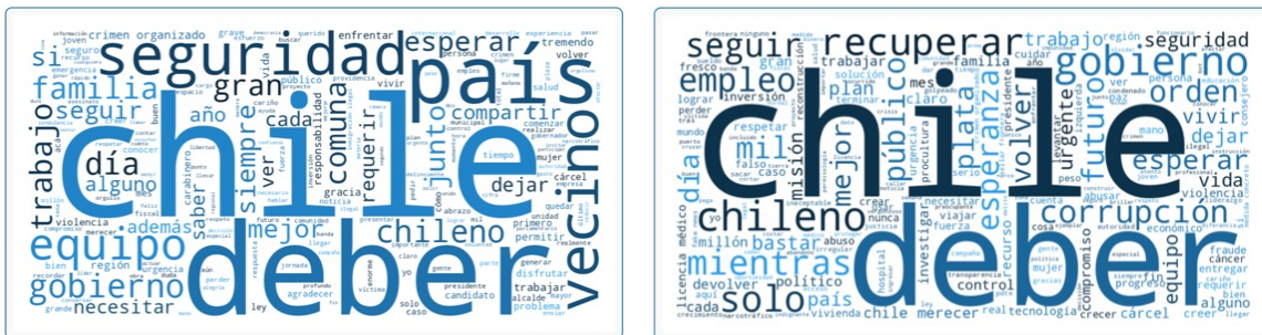
Figura 2: Nube de palabras de la candidata Evelyn Matthei en Twitter, periodos pre-campaña (izquierda: agosto 2024-abril 2025) y campaña (derecha: mayo 2025-junio 2025). Fuente: Radar Político de FK Economics (2025).

En definitiva, el problema no radica en la intención de renovar la imagen, sino en hacerlo sin una lectura fina del marco cognitivo del electorado. La buena comunicación política no se limita a transmitir mensajes: su verdadero poder radica en reforzar identidades. En el caso de Matthei, el intento de alterar su identidad comunicacional ha debilitado precisamente aquello que la hacía más competitiva en el escenario electoral chileno.