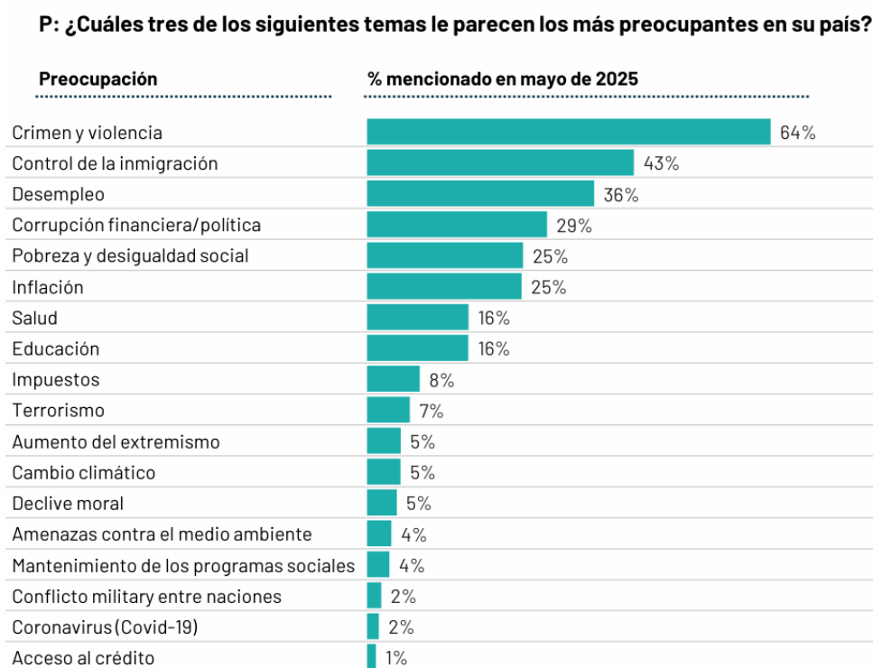
Figura 3: Preocupaciones de Chile en mayo 2025.