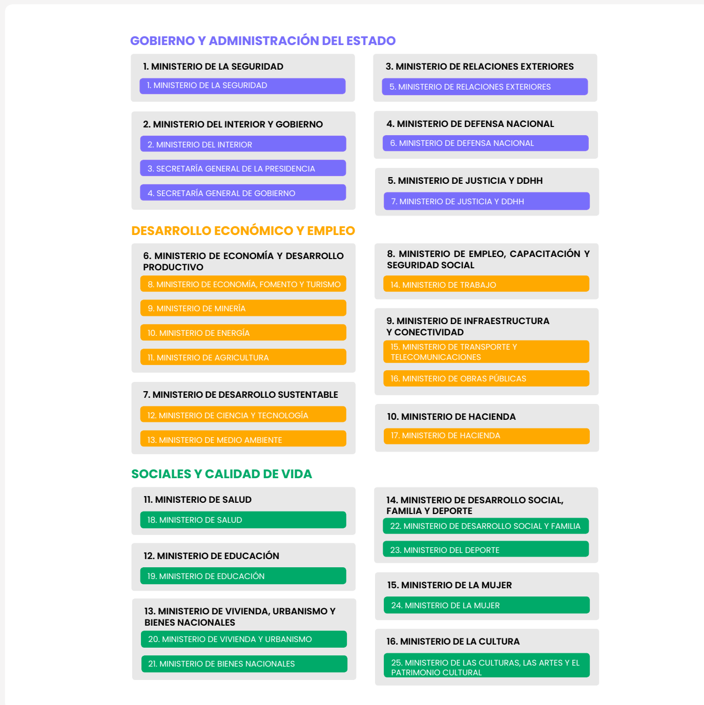
Figura 1: Propuesta de reorganización ministerial